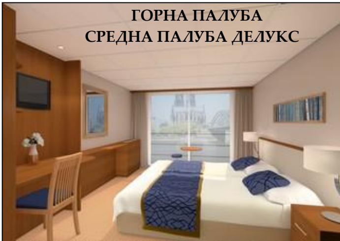
ГОРНА ПАЛУБА СРЕДНА ПАЛУБА ДЕЛУКС